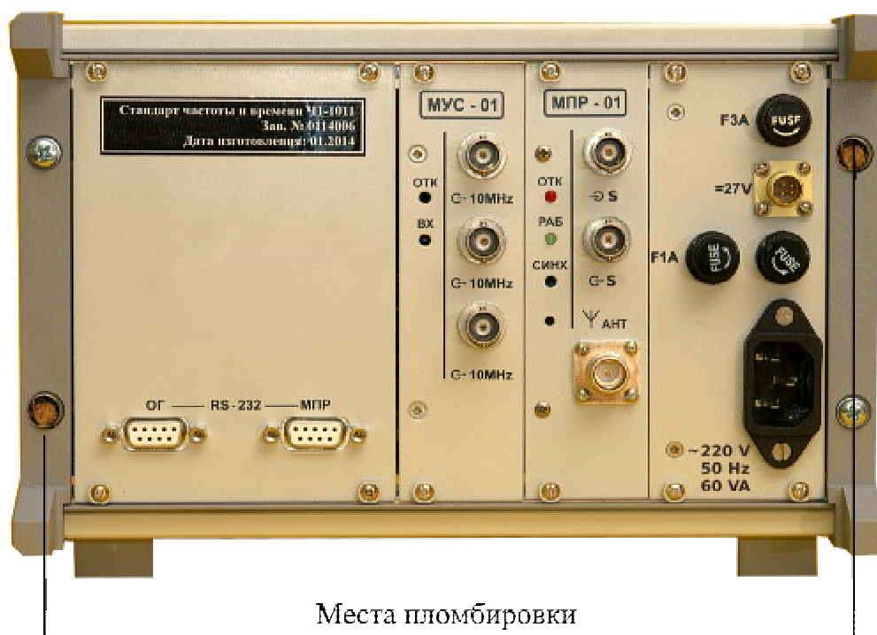
Рисунок 2 – Схема пломбировки от несанкционированного доступа.

Схема пломбировки стандартов от несанкционированного доступа приведена на рисунке 2.