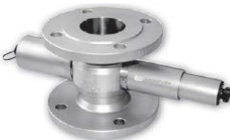
Рисунок 3 – Общий вид датчиков MOD-A16, MOD-T16