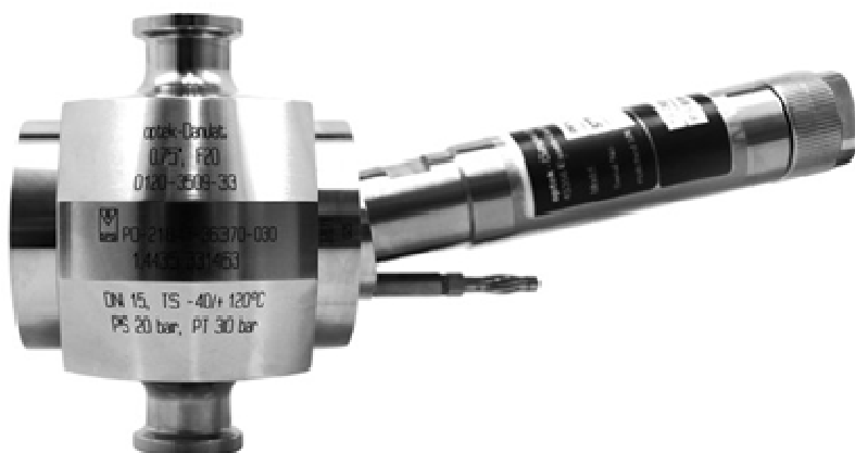
Рисунок 7 – Общий вид датчика pH MOD-P12