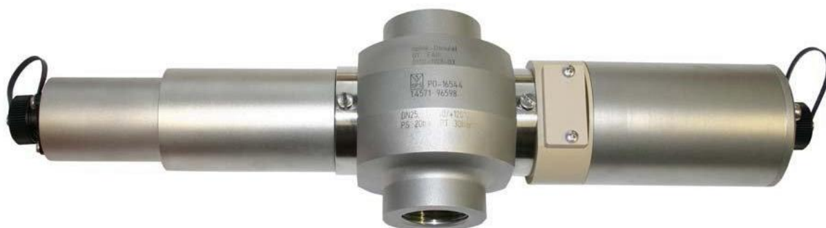
Рисунок 4 – Общий вид датчиков MOD-A26