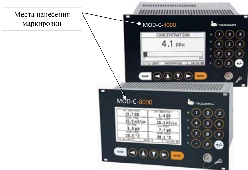
Рисунок 1 – Общий вид конвертеров MOD-C-4XXX и универсальных преобразователей MOD-C-8XXX с указанием места нанесения маркировки