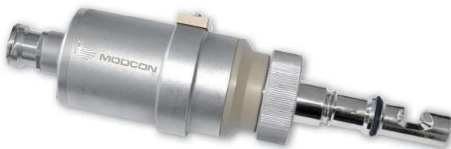
Рисунок 6 – Общий вид датчиков MOD-S16, MOD-S56