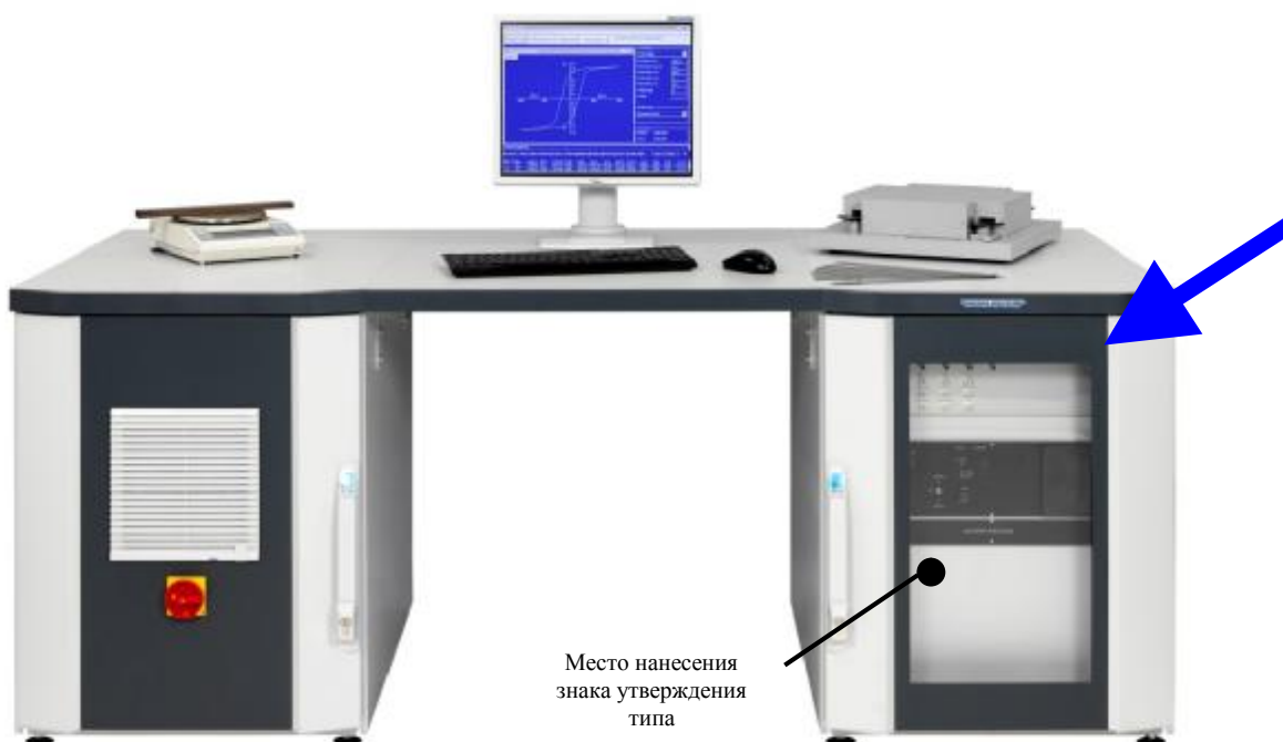
Рисунок 2 – Общий вид установки магнитоизмерительной MPG 200 D