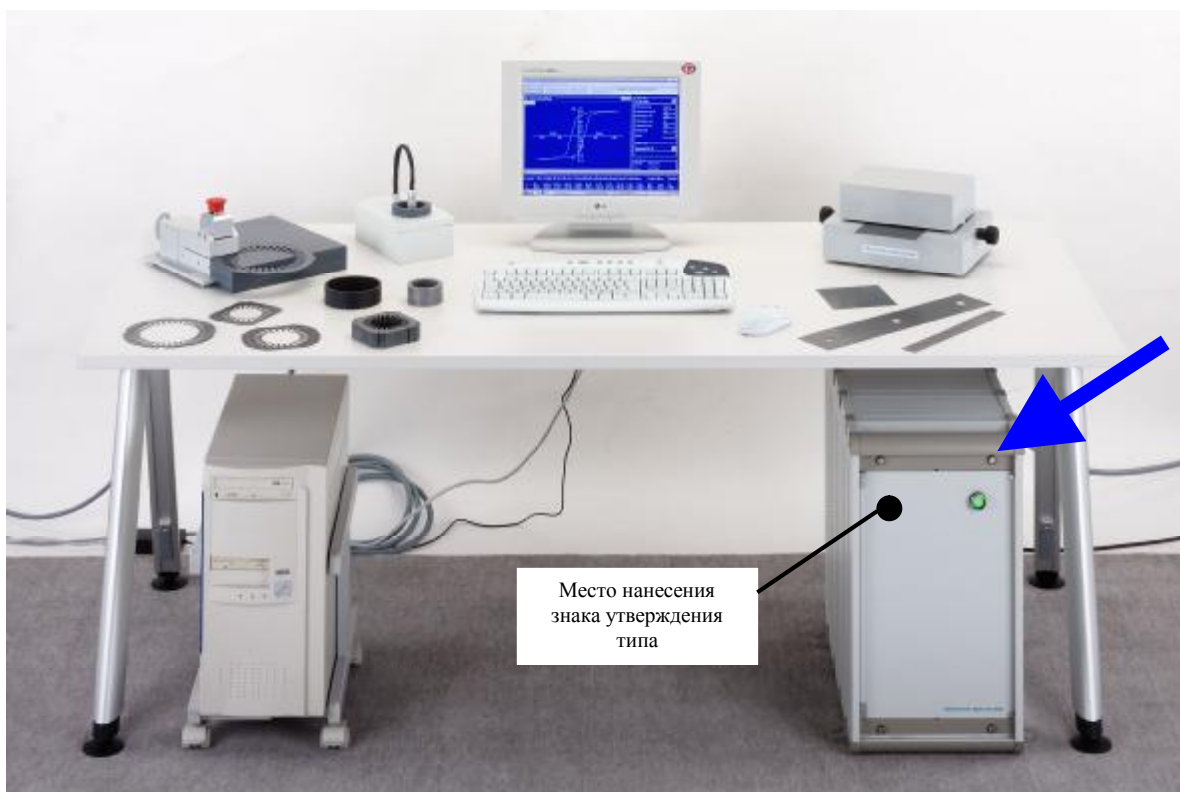
Рисунок 1 – Общий вид установки магнитоизмерительной С 510