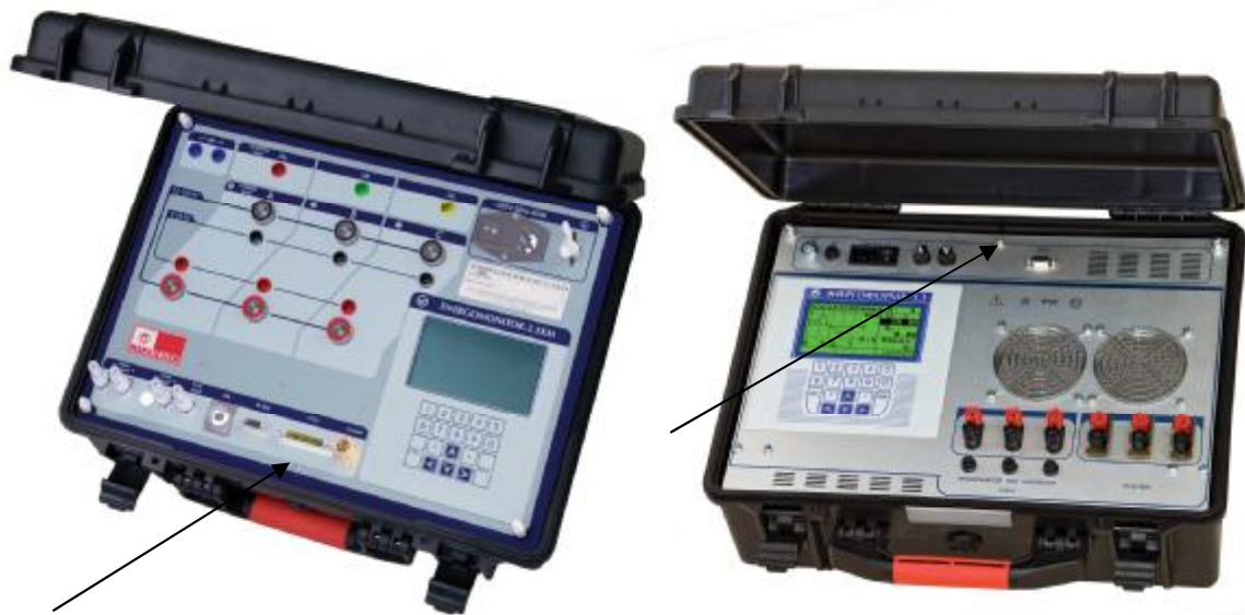
Рисунок 2. Установка "УППУ-МЭ 3.1КМ-П". Общий вид.