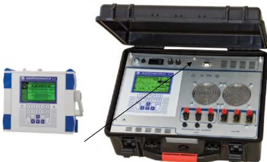
Рисунок 3. Установка "УППУ-МЭ 3.3Т1-П". Общий вид.

(Клеймение переносных установок после поверки производится в виде отиска клейма поверителя на крепежных винтах в местах, указанных стрелками).