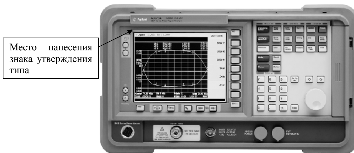
Рисунок 1. – Внешний вид измерителей N897XA. Передняя панель

Внешний вид измерителя N897XA приведен на рисунке 1, схема пломбировки от несанкционированного доступа приведена на рисунке 2.