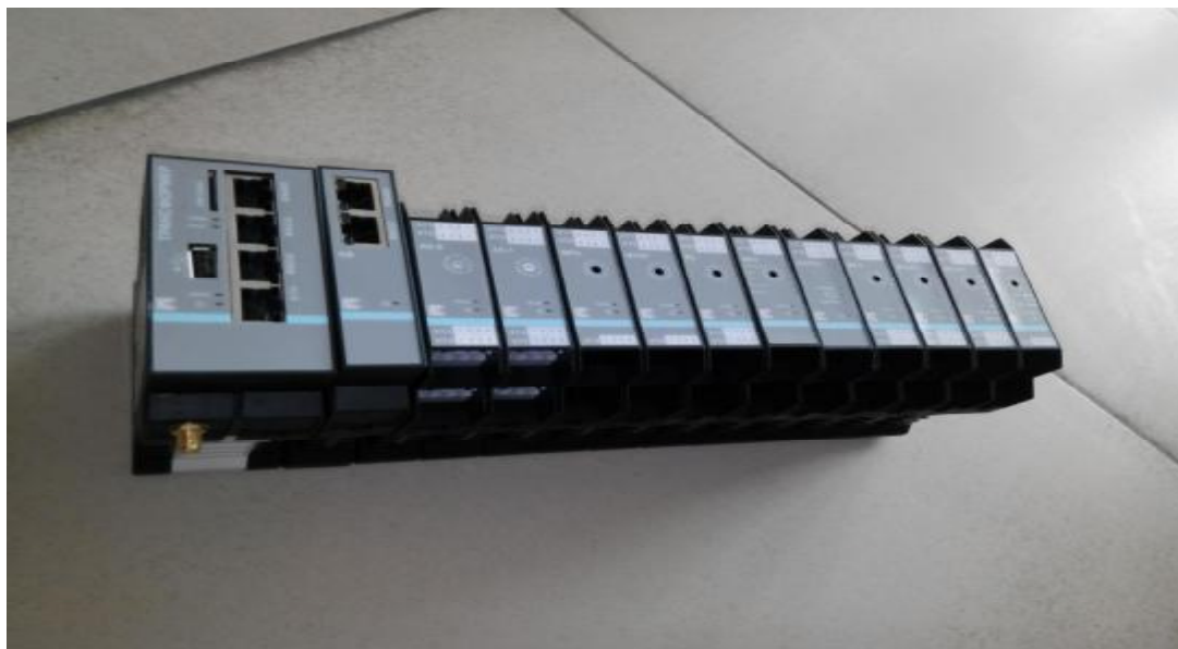
Рисунок 1 – общий вид возможной комплектации приборов микропроцессорных Трансформер – SL

Модуль прибора - конструктивно законченный элемент, заключённый в корпус. На каждом модуле прибора имеется гарантийная наклейка (рисунок 3).