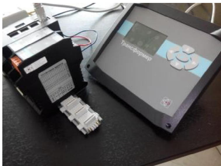
Рисунок 2 – прибор микропроцессорный Трансформер – SL, укомплектованный модулями А8-0, А5-0-1, МВ, ИК5.5