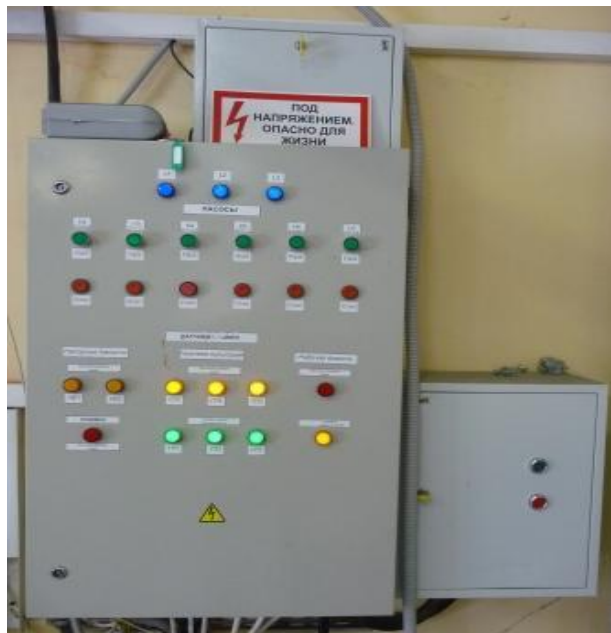
Рисунок 4. Шкаф управления насосами и автоматикой

Поверяемые СИ устанавливаются в измерительный участок рабочего стола, состоящего из рамы, ванны для слива воды, зажимных устройств, запорной арматуры, манометров, термопреобразователей и специальных компенсирующих проставок. Конструкция модификации рабочего стола РС позволяет осуществлять реверсирование потока воды.