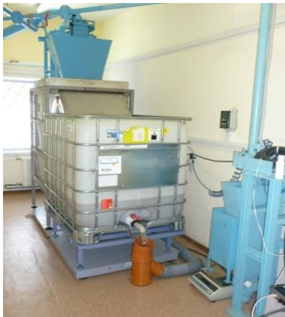
Рисунок 3 Узел переключателей потока и весов