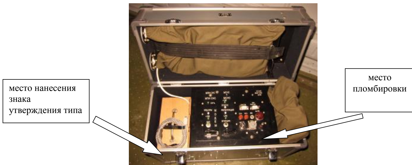
Рисунок 2 – Внешний вид станции поправок спутниковых навигационных систем СП СНС