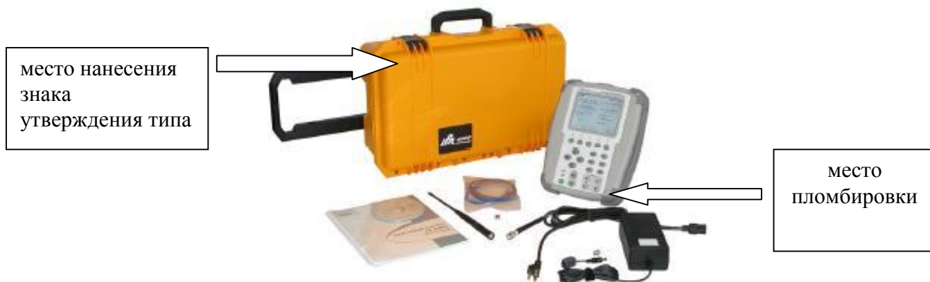
Рисунок 5 – Внешний вид имитатора сигналов маяков дальномерных Aeroflex IFR 6000