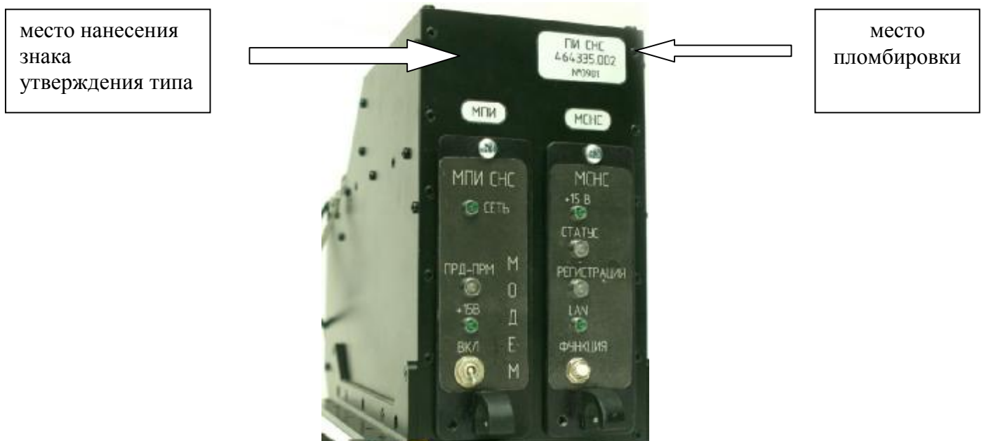
Рисунок 1 – Внешний вид приемника измерительного спутниковых навигационных систем ПИ СНС

Внешний вид составных частей системы с указанием мест размещения знака утверждения типа и мест пломбировки от несанкционированного доступа приведен на рисунках 1-5.