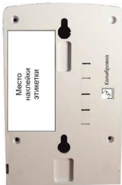
Рисунок 2 – Фотография мест для пломбирования сигнализатора загазованности природным газом СЗ-1Е.