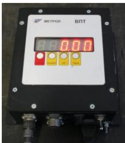
Рисунок 2 - Общий вид терминала

Весы оснащены стандартным последовательным интерфейсом передачи данных RS-485 для подключения весов к персональному компьютеру.