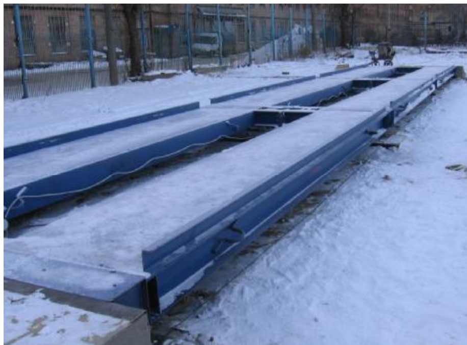
Рисунок 1 - Общий вид грузоприемного устройства