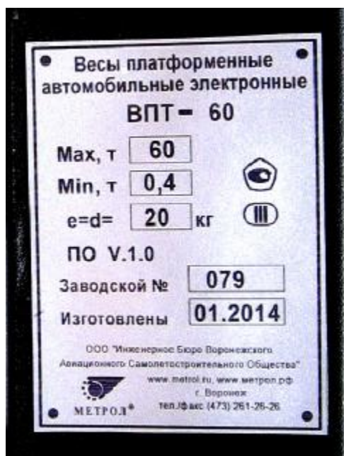
Рисунок 3 – Маркировка весов ВПТ