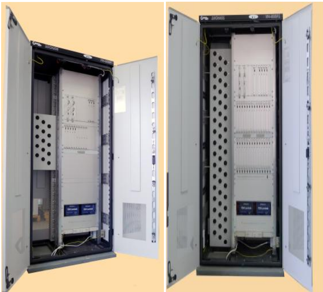
Рисунок 2 Фото общего вида шкафов аппаратуры «Гиндукуш-Ф»

К БВВ относятся: БВЦ-260Р – блок ввода релейных сигналов; БВЦ-261Р – блок ввода потенциальных сигналов; БВЦ-262Р – блок вывода релейных сигналов; БКХ-34Р – блок контроля и диагностики; БПА-64Р, БПА-65Р, БПА-66Р, БПА-67Р, БПА-68Р – преобразователи аналого-цифровые (АЦП).