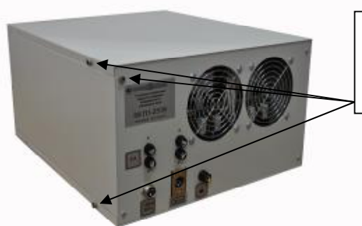
Рисунок 3 – Места пломбирования