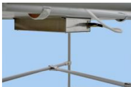
Рисунок 2 – Блок конденсаторов