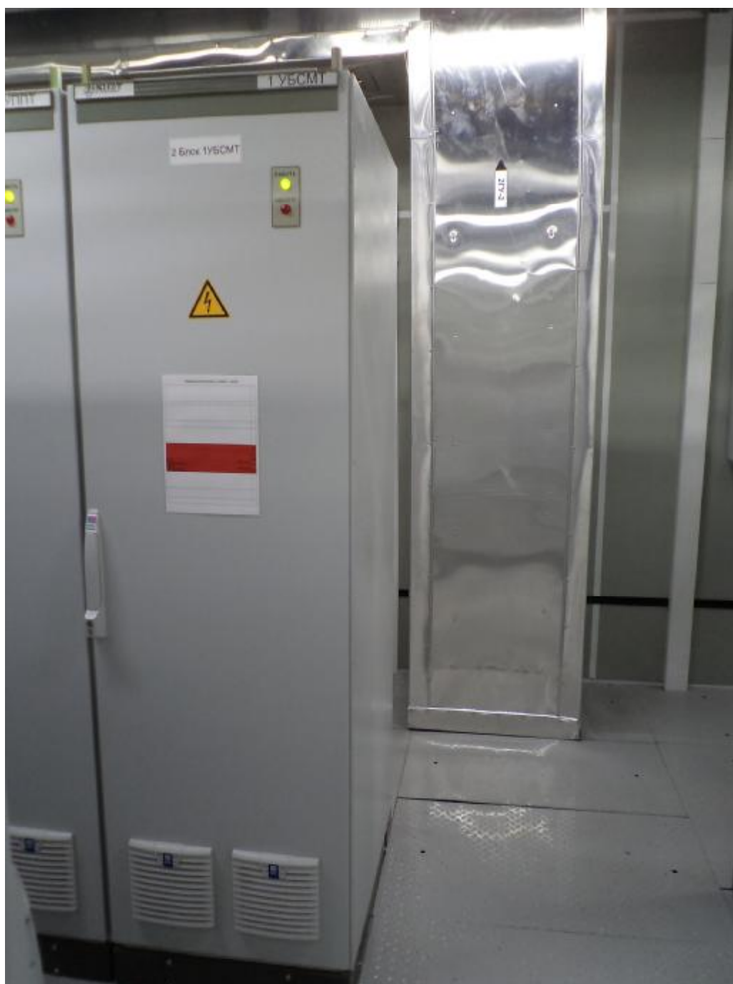
Рисунок 1 - Фотография общего вида вторичной части ИК АЗРТ