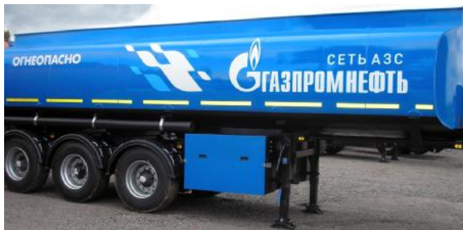
Фото 1. Общий вид полуприцепа-цистерны КАПРИ-ППЦ

На боковых поверхностях и сзади цистерн имеются надписи «Огнеопасно» и знаки с информационными табличками для обозначения транспортного средства, перевозящего опасный груз.