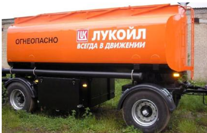
Фото 3. Общий вид прицепа-цистерны КАПРИ-ПЦ