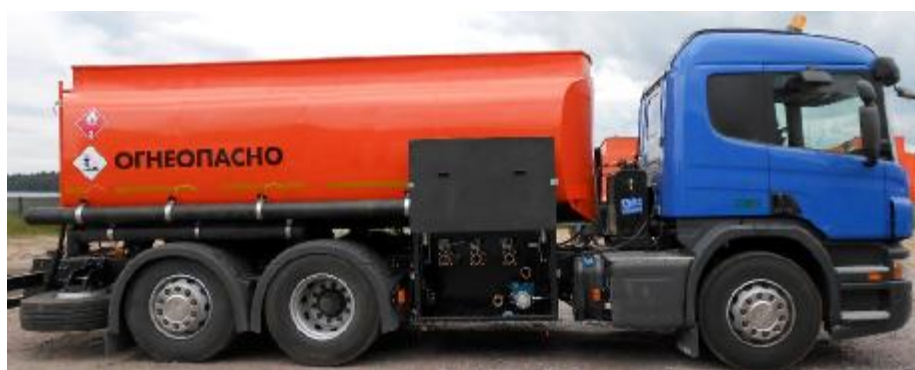
Фото 2. Общий вид автоцистерны КАПРИ-АЦ