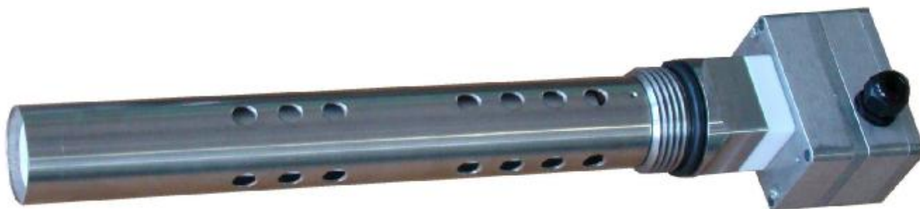
Рисунок 1 -Первичный преобразователь ДЖС-7В измерителя влажности ДЖС-7В Систем измерительных СУ-5Д

Блок искрозащиты ИЗК-3 и индикатор ОВЕН СМИ1 размещаются во взрывобезопасной зоне. Результаты измерений передаются от ИЗК-3 на индикатор ОВЕН СМИ1 по каналу связи RS485. Также имеется возможность передачи результатов измерений по каналу RS485 на внешние вычислительные системы.