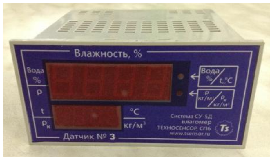
Рисунок 3 - Индикатор ОВЕН СМІ1 измерителя влажности ДЖС-7В Систем измерительных СУ-5Д