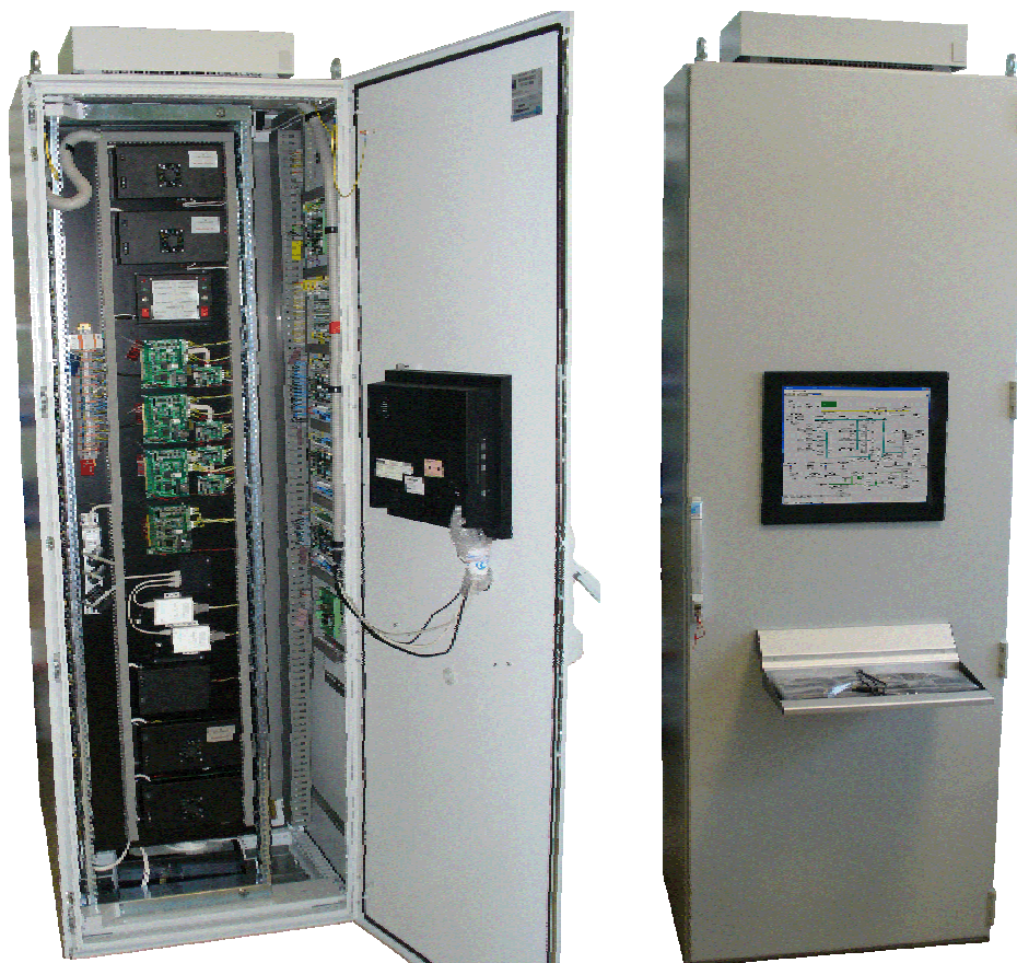
Рисунок 1.2 – Контроллер ПТК «Космотроника - Венец»