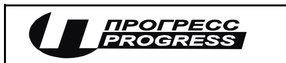
Рисунок 3 - Форма вид стикера, предназначенного для контроля доступа к контроллерам нижнего уровня.