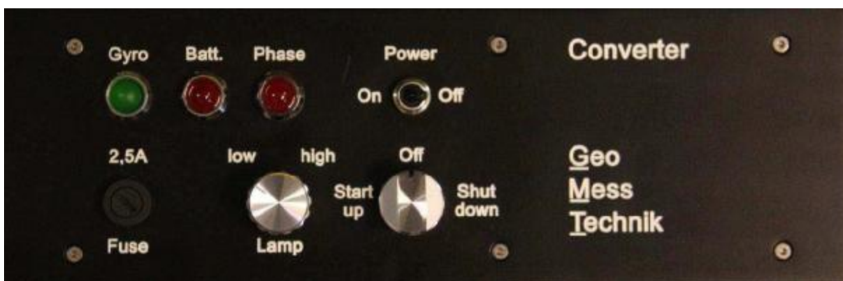
Рисунок 3 – Панель управления конвертера гиронасадки