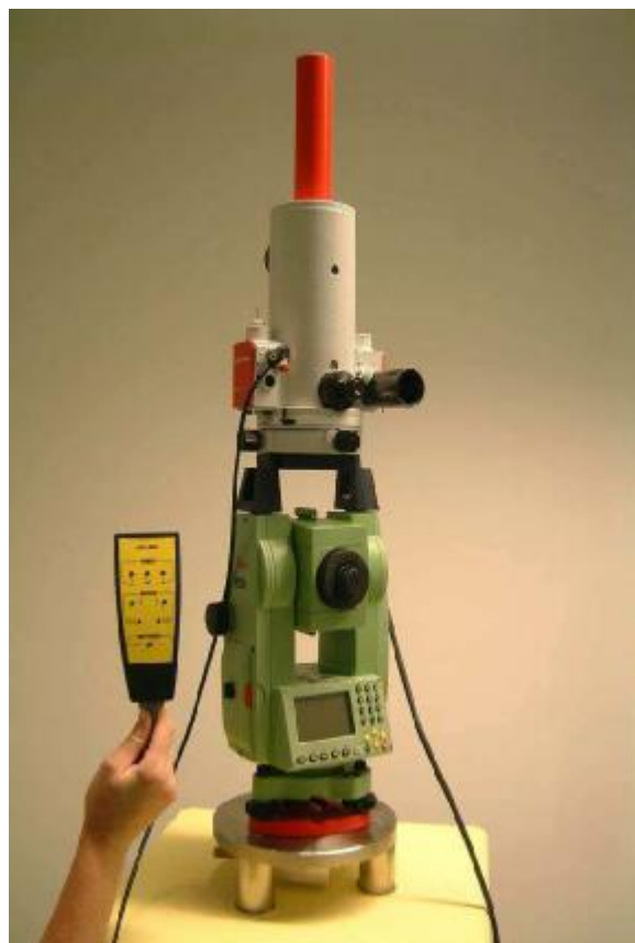
Рисунок 1 – Вид гиронасадки со стороны окуляра