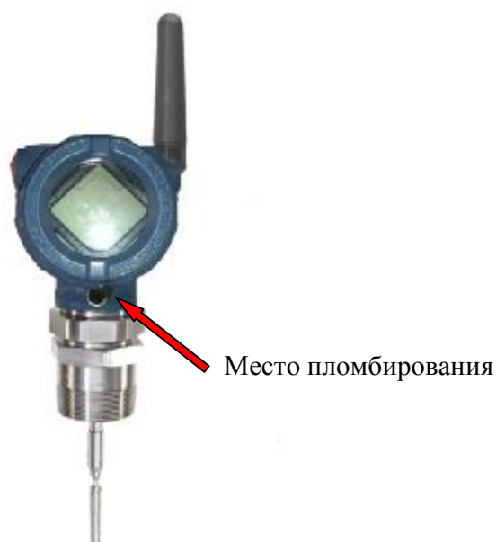
Рисунок 1 – Общий вид уровнемеров 3308

Общий вид уровнемеров 3308 приведен на рисунках 1 и 2. Место пломбирования уровнемеров 3308 от несанкционированного доступа приведено на рисунке 1.