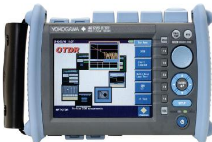
Рисунок 1 - Общий вид рефлектометра оптического AQ1200, AQ1205