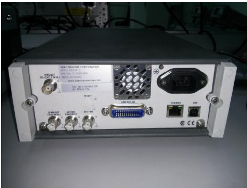
Рисунок 2 – Внешний вид имитатора (задняя панель)