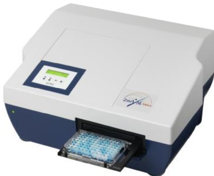
Рисунок 1 – Общий вид Фотометров микропланшетных Zenyth 340, модели Zenyth 340 R и Zenyth 340 RT

Схема маркировки и пломбировки фотометров представлена на рисунке 2.