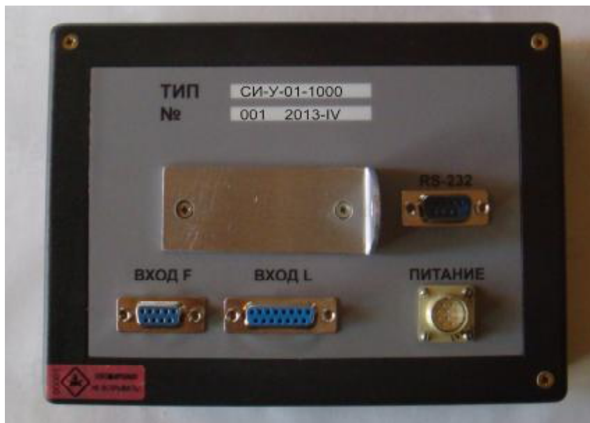
Рисунок 2. Место опломбирования блока СИ-У-01