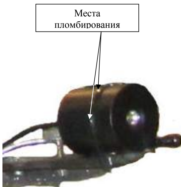
Рисунок 3 - Общий вид радиометрической головки с указанием мест пломбирования