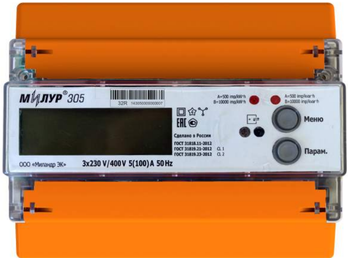
Рисунок 1 – Внешний вид счетчика