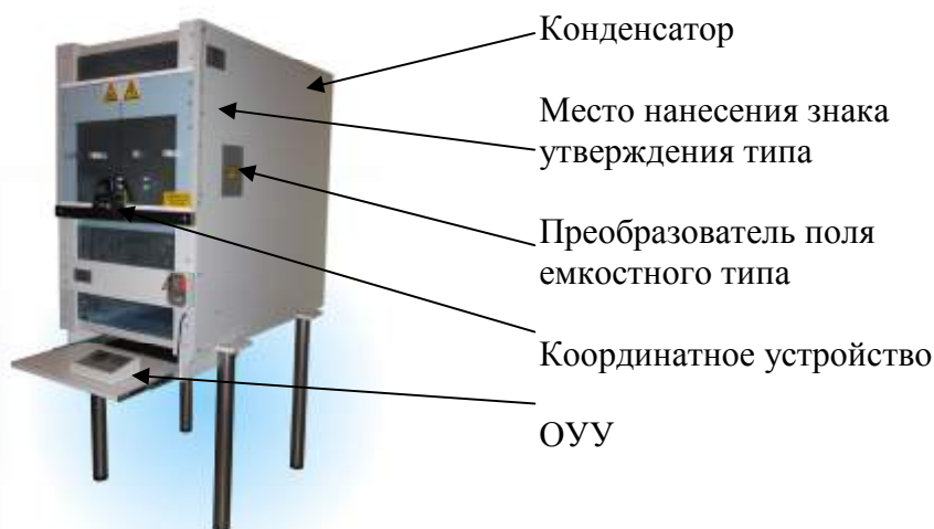
Рисунок 1 – Внешний вид установок

Элементы установок, влияющие на метрологические характеристики, защищены от несанкционированного доступа при помощи пломбирования и лакокрасочного покрытия (рисунок 2).