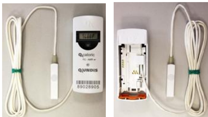
Фото 2. Фотографии общего вида устройства с выносным датчиком температуры

Полная расшифровка ASN номера определяется в соответствии с технической документацией при заказе товара.