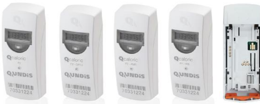
Фото 1. Фотографии общего вида

Общий вид устройства представлен на фото 1 и 2.