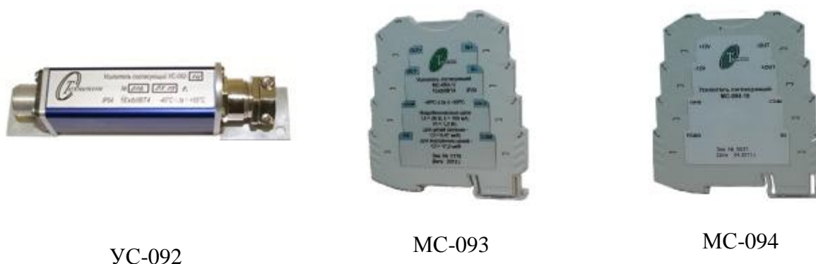
Рисунок 4 - Внешний вид усилителей согласующих УС-092, МС-093, МС-094

В качестве измерительного прибора используются преобразователь виброизмерительный вторичный СТД-3168 с модулем аналогового вывода и преобразователь сигналов VCM, внешний вид которых приведен на рисунке 5.