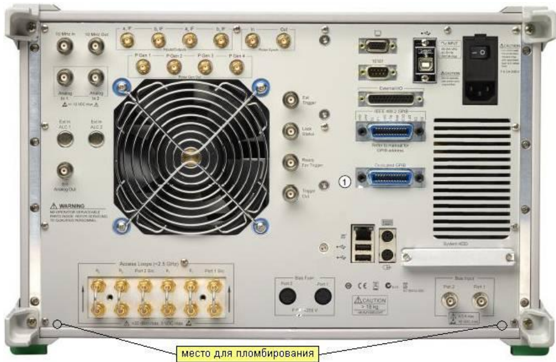
Рисунок 2 – Задняя панель анализатора и места для пломбирования.

На рисунке 3 представлен внешний вид анализатора с блоком расширения портов.