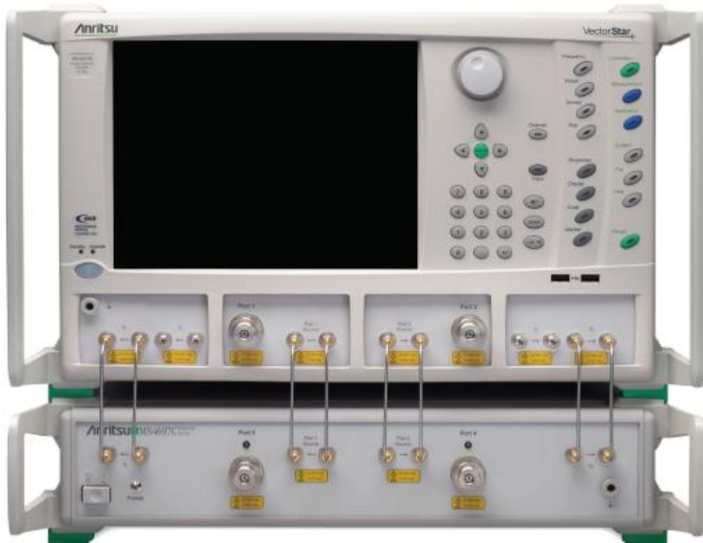
Рисунок 3 - Внешний вид анализатора с блоком расширения портов.

На рисунке 3 представлен внешний вид анализатора с блоком расширения портов.