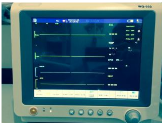
Рисунок 2 - Внешний вид WQ-002