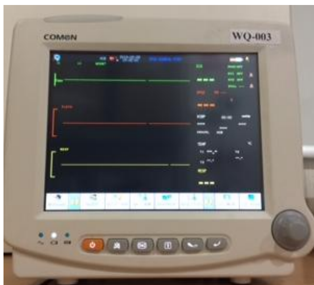
Рисунок 3 - Внешний вид WQ-003