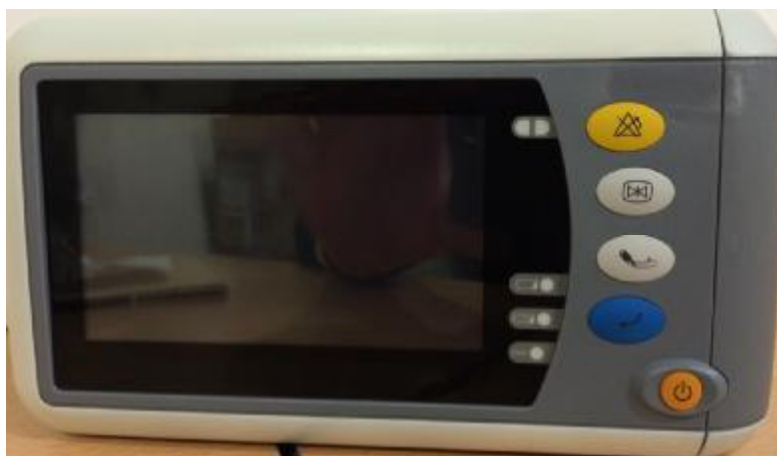
Рисунок 4 - Внешний вид WQ-004