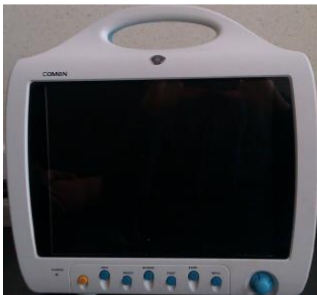
Рисунок 1 - Внешний вид WQ-001