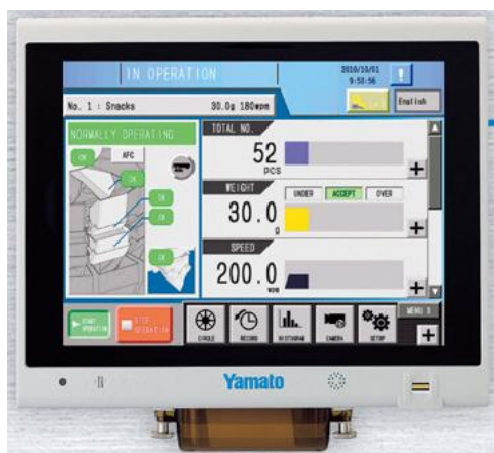
Рисунок 2 – Внешний вид индикатора RCU-1000