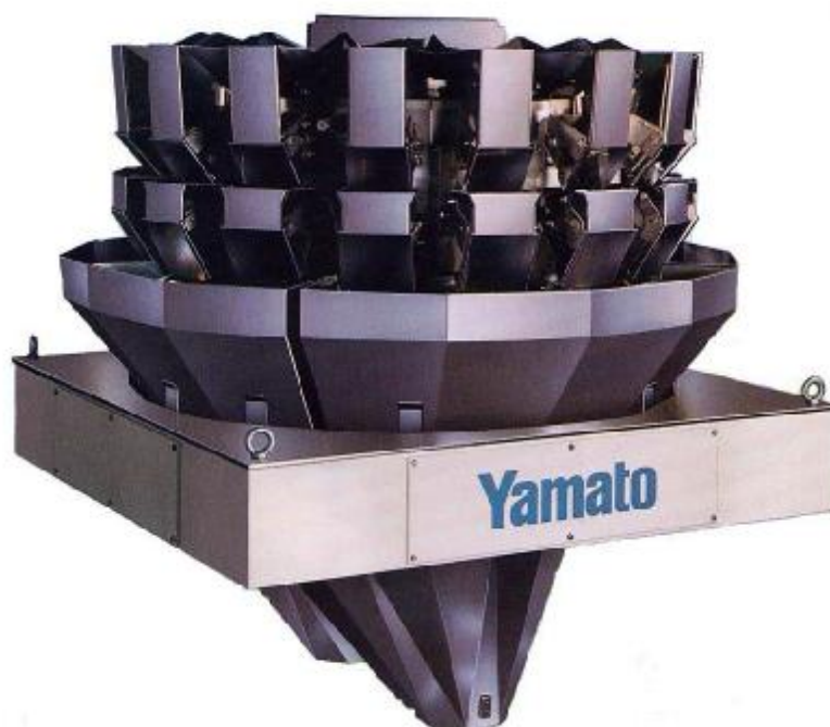
Рисунок 1 – Общий вид дозаторов

Общий вид дозаторов представлен на рисунке 1.