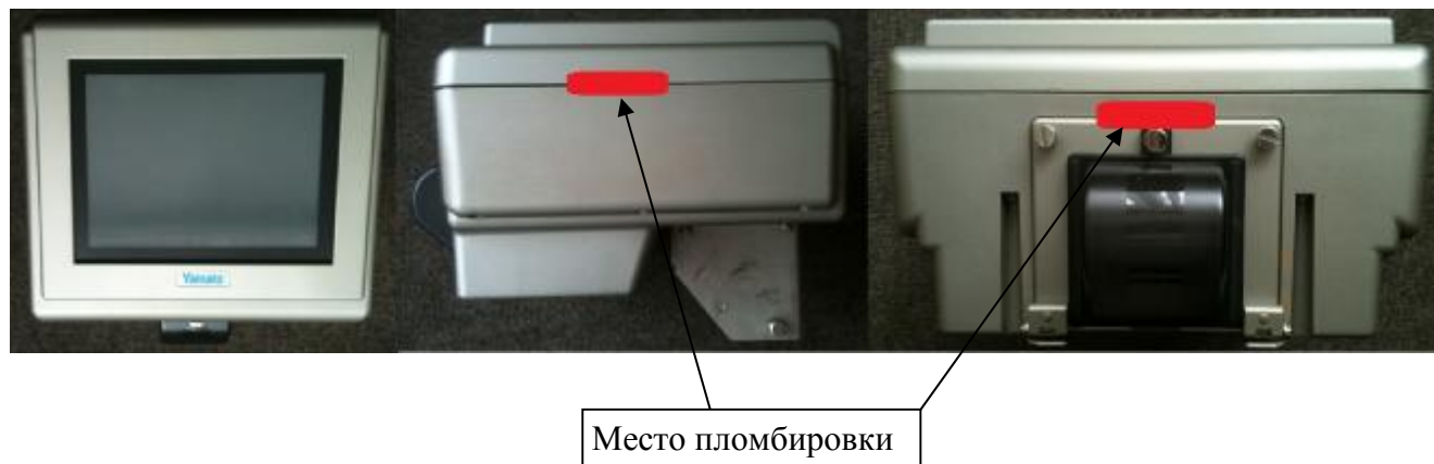
Рисунок 6 – Пломбировка корпуса индикатора RCU -810A

Дозаторы выпускаются в двух модификациях, отличающиеся модификацией индикатора (контроллера), дискретностью задания номинального значения массы дозы и дискретность отсчета массы дозы, количеством весоизмерительных тензорезисторных датчиков, и имеют обозначение ADW-O-...-X 1 -X 2 -X 3 -X 4 и ADW-X 1 -X 2 -X 3 -X 4 , где: