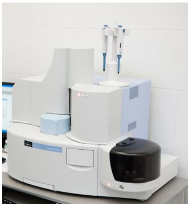
Рисунок 1 - Внешний вид анализатора