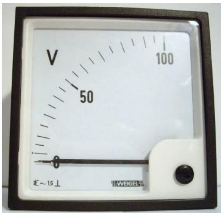
Вольтметр аналоговый EQ Рис. 2