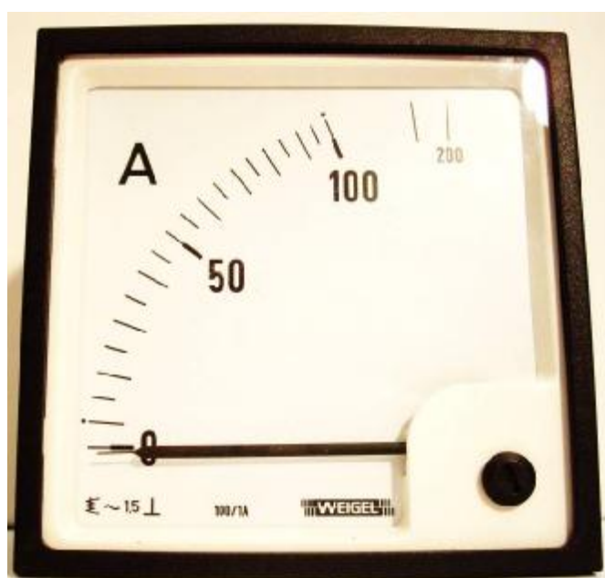
Амперметр аналоговый EQ

Фотографии амперметров и вольтметров представлены на рисунках 1 и 2, на рисунке 3 – место пломбировки наклейкой.