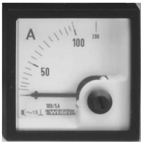
Амперметр с одинарной шкалой Рис. 2