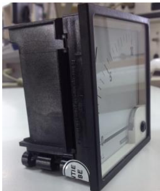
Место наклейки Рис.3