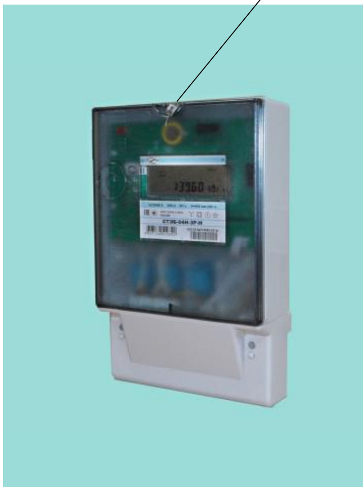
Рисунок 1 – Фотография общего вида и места установки пломбы поверителя счетчиков СТЭБ-04Н-3Р-Н