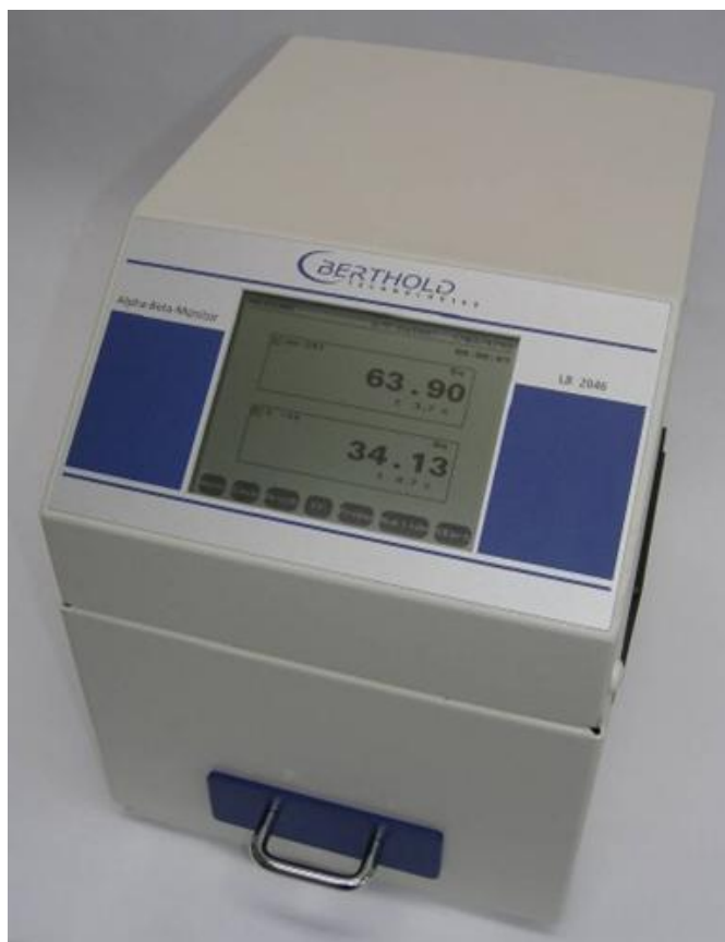
Рисунок 1 – Внешний вид радиометра

Внешний вид радиометра представлен на рисунке 1.