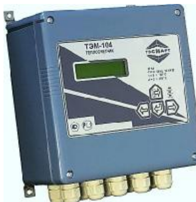
Рисунок 2. Внешний вид ИВБ

Типы ТС, ИП и ДИД применяемые в составе теплосчетчика, указаны в Таблицах 1, 2, 3.