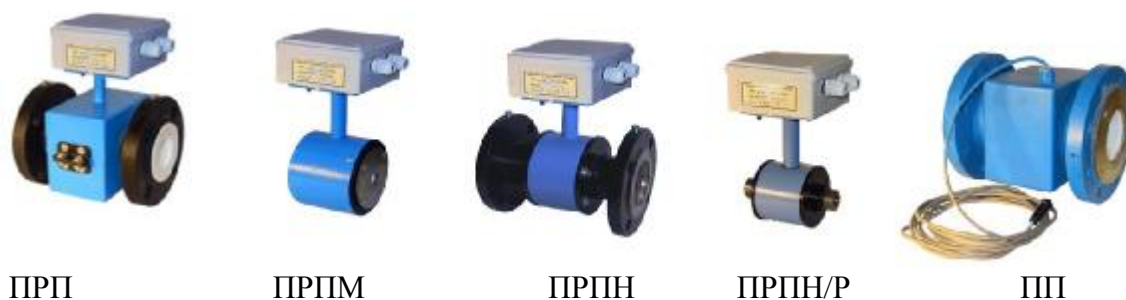
Рисунок 1. Внешний вид ППР

Типы и внешний вид ППР и ИВБ приведены на рисунках 1 и 2.