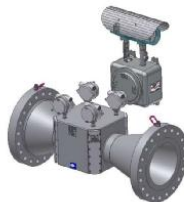
Расходомеры раздельного исполнения