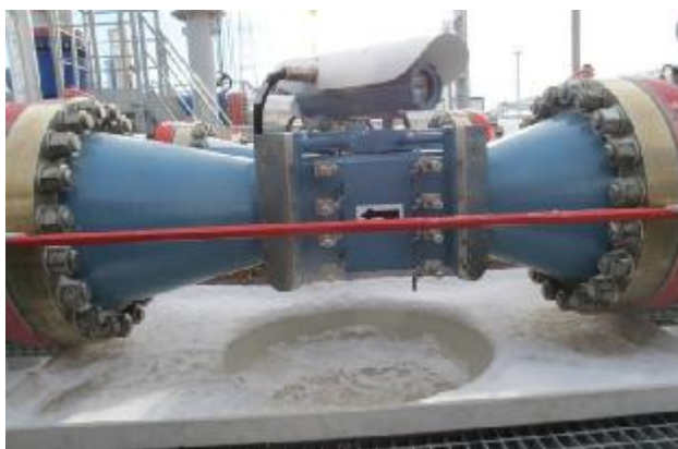
Расходомеры с портами продувки