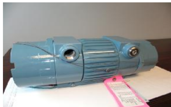
Рисунок 3 – Место пломбировки передатчика расходомера ультразвукового LEFM 280CiRN-M