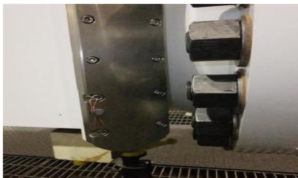
Рисунок 2 – Места пломбировки блоков ПАУ на корпусе расходомера ультразвукового LEFM 280CiRN-M

Для защиты расходомера от несанкционированного доступа в местах, указанных на рисунках 2 и 3 размещают пломбы с оттиском клейма поверителя.