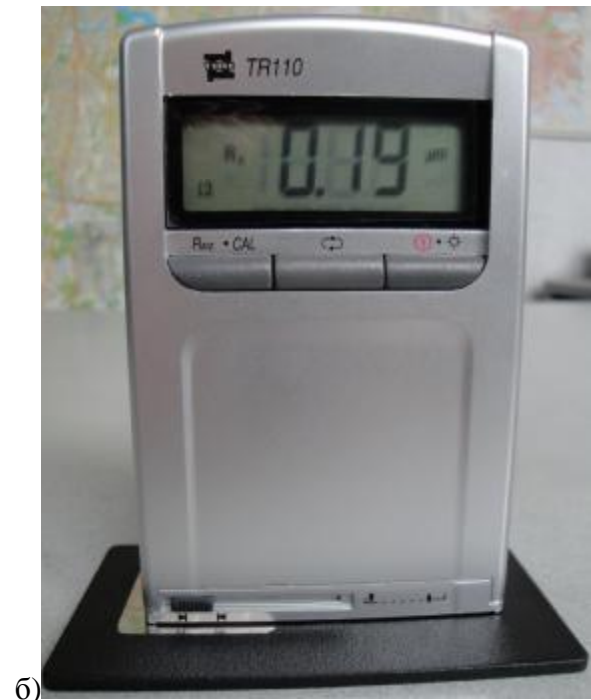
Рисунок 1 – Общий вид прибора серии TR100: а - TR100, б - TR110

Приборы серии TR200 (рис. 2) предназначены для измерения параметров шероховатости сложных поверхностей: измерения в отверстиях, в пазах, на криволинейной поверхности. Принцип работы профилометра заключается в следующем: при определении шероховатости детали на поверхности располагают датчик с иглой, который получает информацию о неровности поверхности при перемещении щупа в основании прибора. Параметры шероховатости и график профиля рассчитываются согласно с выбранной методикой и выводятся на жидкокристаллическом экране. Прибор TR210 - упрощенная модель прибора TR200, которая предназначена для измерения шероховатости по четырем параметрам. Прибор TR220 является усовершенствованной моделью прибора TR200 с возможностью измерения по 16 шкалам. Профилометры TR200, TR210, TR220 можно использовать с дополнительными вспомогательными приспособлениями. Для контроля деталей с малыми размерами рекомендуется использовать регулируемую подставку и чехол для датчика. Для увеличения глубины ввода датчика в деталь, применяется удлинительный стержень. Для регулировки положения прибора относительно контролируемой детали, используются микроизмерительный стол и стойка со штативом, которые дают возможность регулировать положение прибора, обеспечивая точность измерения на сложных поверхностях.