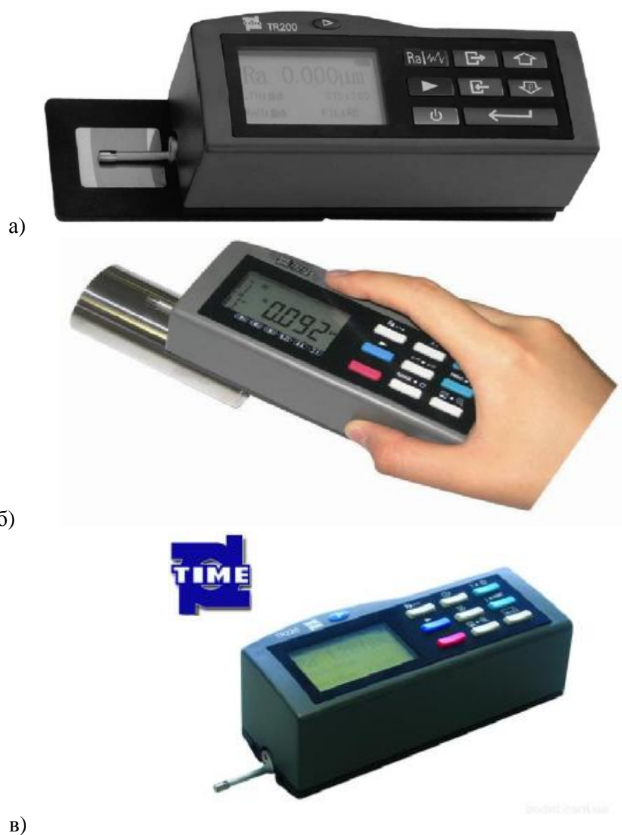
Рисунок 2 – Общие виды прибора серии TR200: а - TR200, б - TR210, в - TR220

Прибор серии TR300 (рис. 3) позволяет измерить 55 параметров шероховатости, для этого устанавливается на измерительную стойку для более точной регулировки положения пера на сложных поверхностях. Прибор оснащен удлинительным стержнем для увеличения глубины ввода датчика в деталь. Параметры шероховатости и график профиля рассчитываются согласно с выбранной методикой и выводятся на жидкокристаллическом экране. Прибор осуществляет связь с компьютером и принтерами компании Time серии ТА.