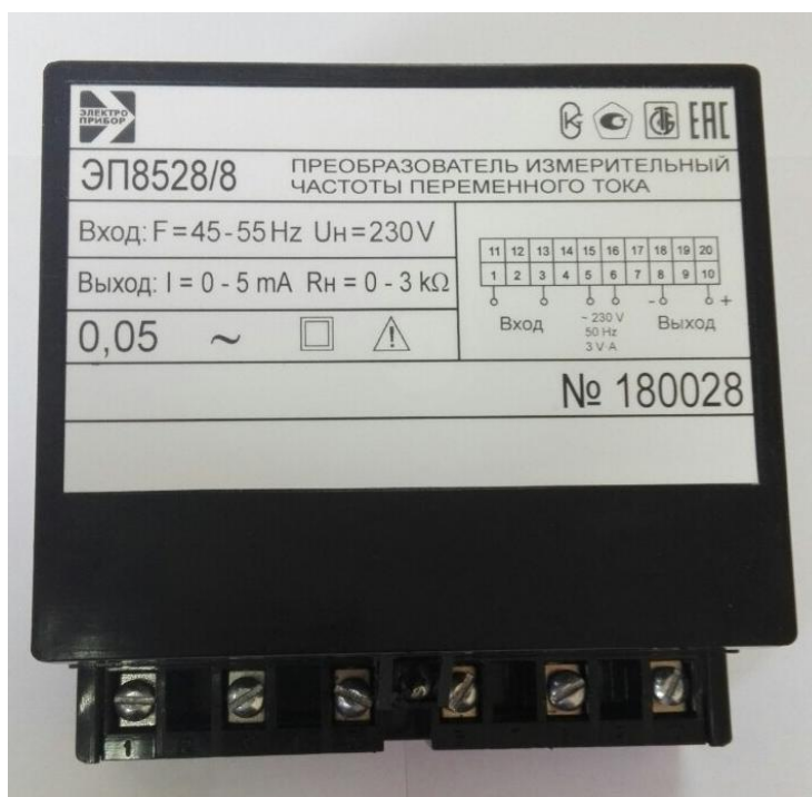
Рисунок 1 – Общий вид средства измерений ЭП8528