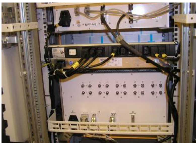
Рисунок 2 - Размещение УИ-14ВЦ в стойке шкафа технических средств (вид сзади)