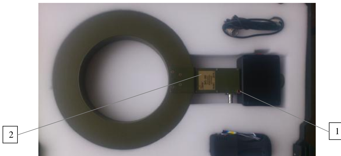
1 – место пломбирования 2 – место знака утверждения типа