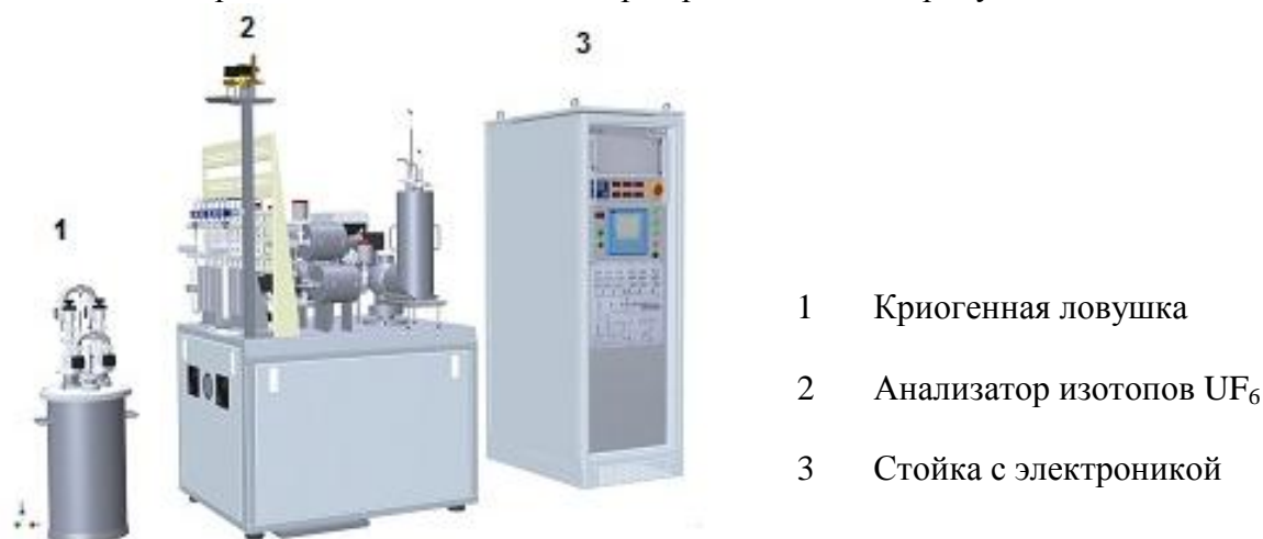
Рисунок 1. Общий вид всех компонентов масс-спектрометра

Общий вид всех компонентов масс-спектрометра, а также детальные изображения стойки с электроникой и блока анализатора представлены на рисунках 1 и 2.