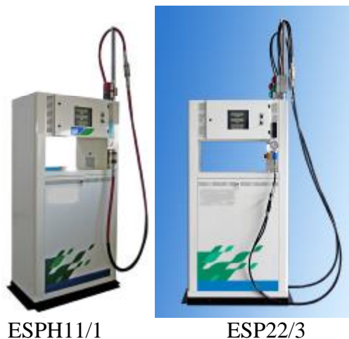
Фото 1. Фотографии общего вида

На рисунке 1 указаны места пломбировки от несанкционированного доступа и место размещения наклеек, в том числе о поверке.