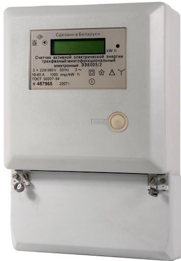
Рисунок 2 – Фотография общего вида ЭЭ8005