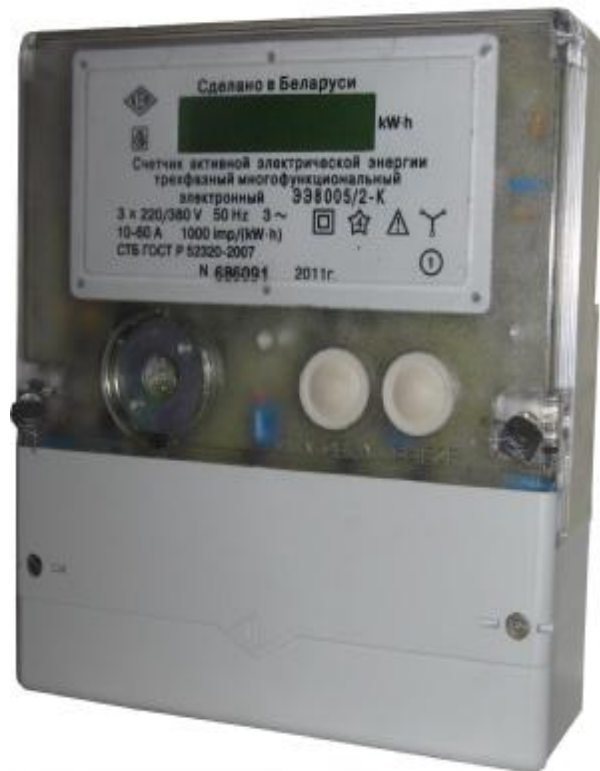
Рисунок 3 – Фотография общего вида ЭЭ8005-К