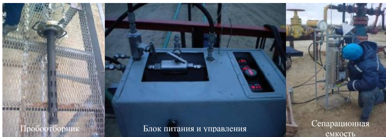
Рисунок 1 – Внешний вид КПИ-1М