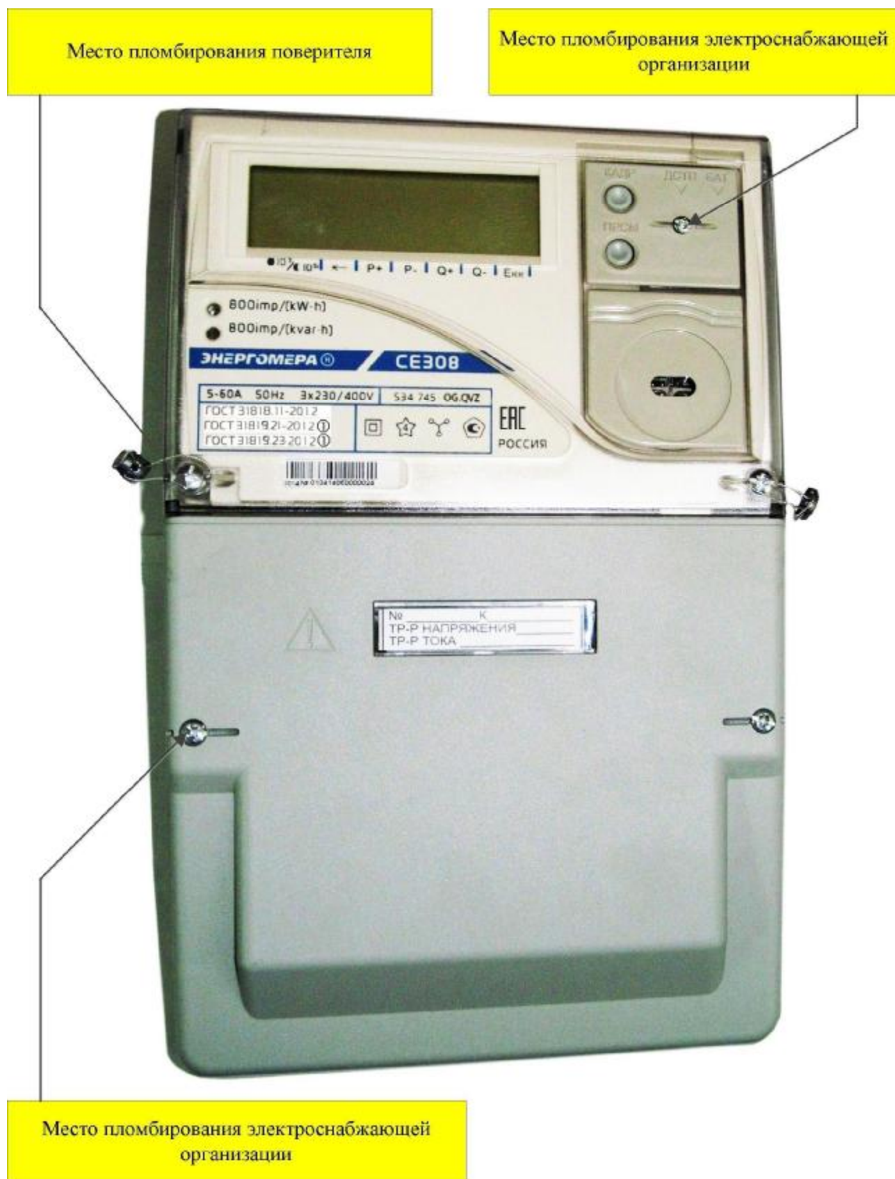
Рисунок 5 – Общий вид счетчика CE308 S34*