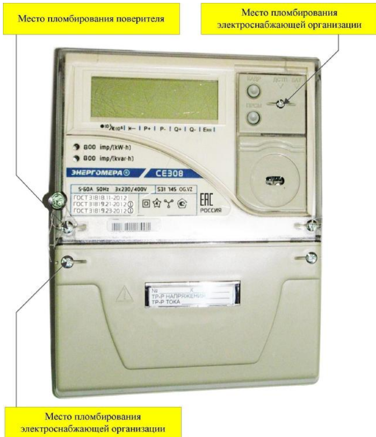
Рисунок 4 – Общий вид счетчика CE308 S31*