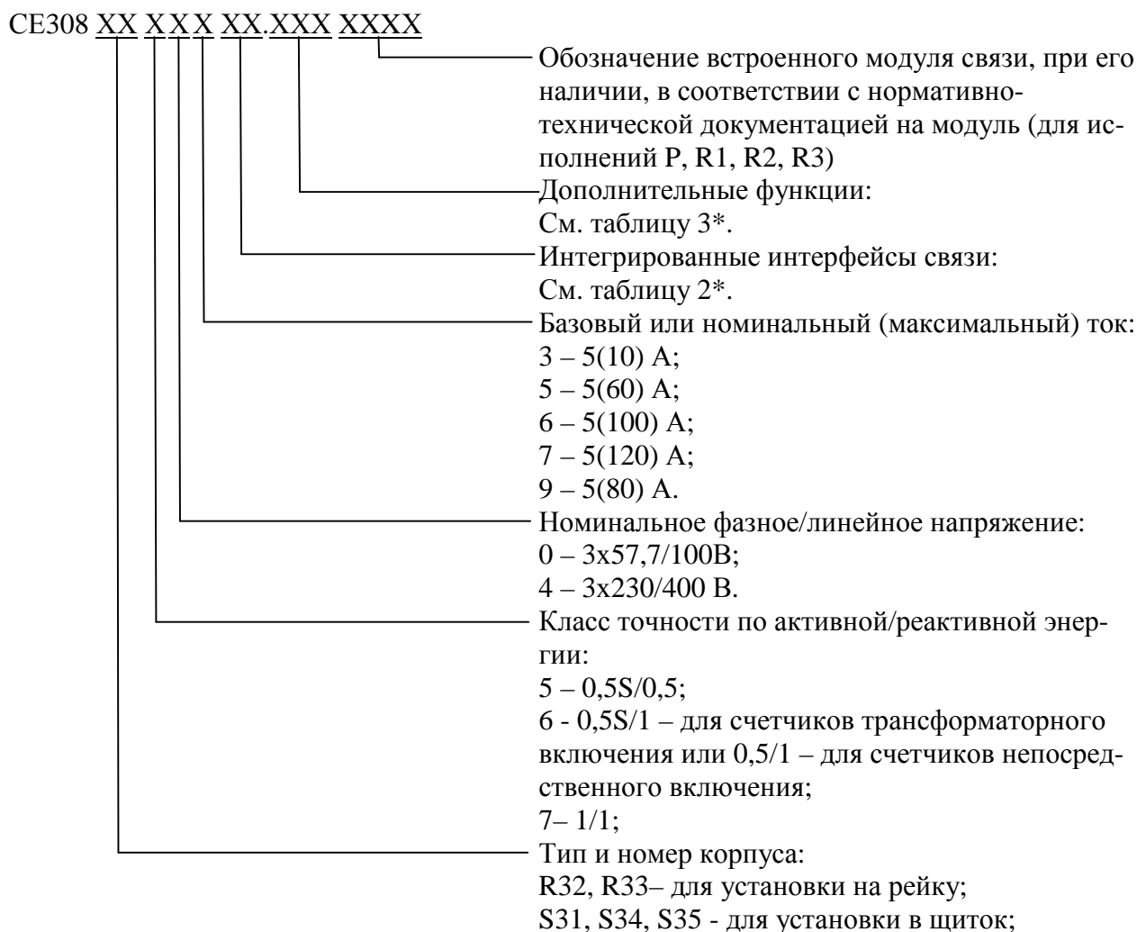
Рисунок 1 - Структура условного обозначения счетчиков

Фото общего вида счетчиков с указанием схемы пломбировки от несанкционированного доступа приведены на рисунке 2, 3, 4, 5, 6.