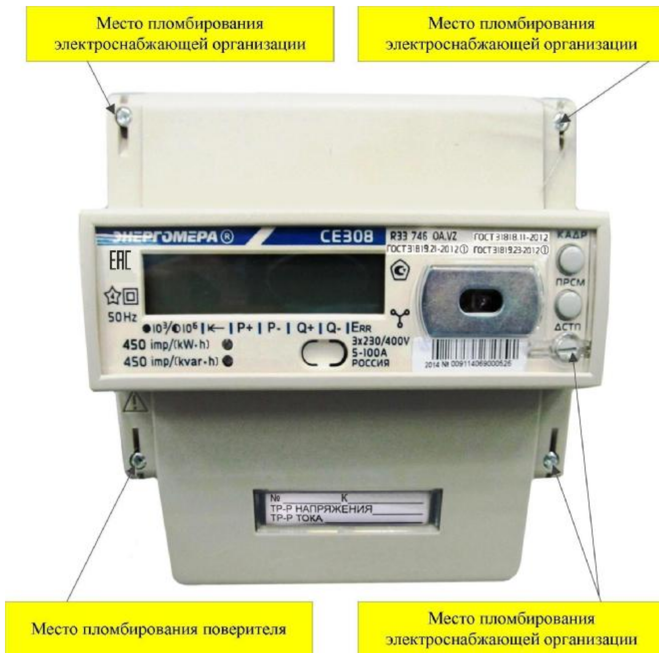
Рисунок 3 – Общий вид счетчика CE308 R33*