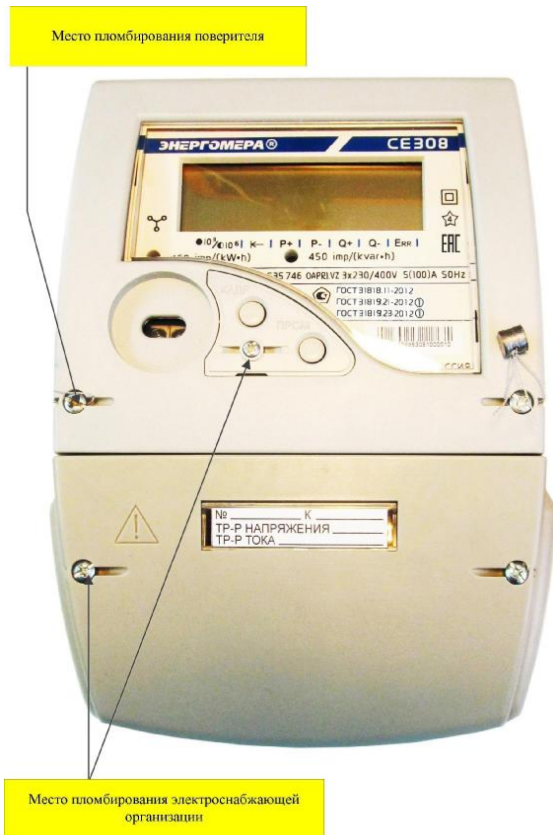
Рисунок 6 – Общий вид счетчика CE308 S35*

Примечание: *- Надписи «10 3 », «10 6 », «P+», «P-», «Q+», «Q-», Err являются вспомогательными и предназначены для облегчения понимания маркеров состояния возникающих на индикаторе. Допускается отсутствие вспомогательных надписей.