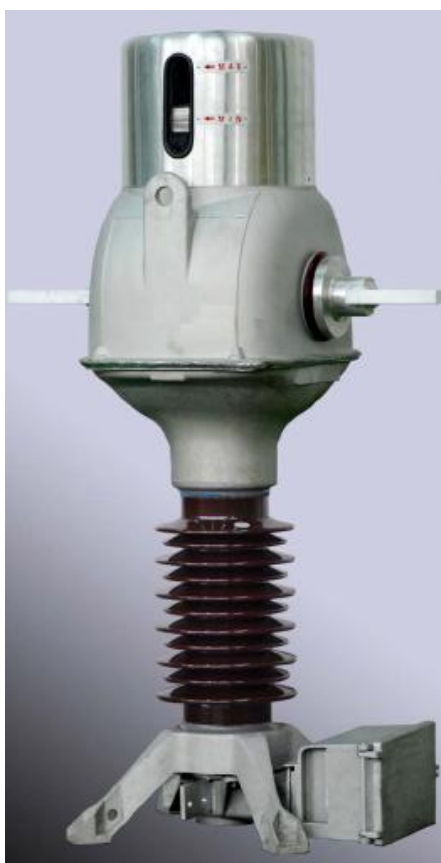
Рис. 2. Трансформатор тока ТФМ-35