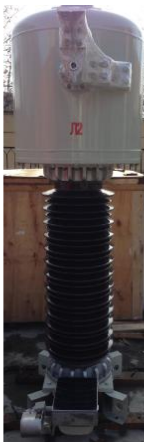
Рис. 2. Трансформатор тока ТОГФ-110