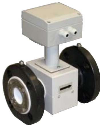
Рисунок 1. Внешний вид расходомера электромагнитного ЭЛТЕКО ЭРМ

ЭБ выполнен в герметичном корпусе. Внутри корпуса расположена печатная плата и элементы присоединения внешних цепей. Выходным сигналом расходомера электромагнитного ЭЛТЕКО ЭРМ является импульсный сигнал типа «открытый коллектор» с программируемым весом импульса. В зависимости от исполнения расходомеры электромагнитные ЭЛТЕКО ЭРМ дополнительно могут комплектоваться платой интерфейса RS232 или RS485.