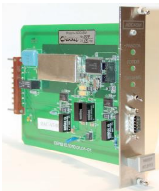
Рисунок 1. Модуль ввода аналоговых сигналов ADC4SM

Внешний вид модуля и преобразователя изображен на рисунках 1 и 2.